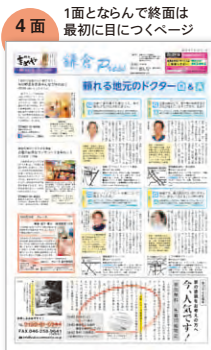
4面 1面とならんで終面は最初に目につくページ