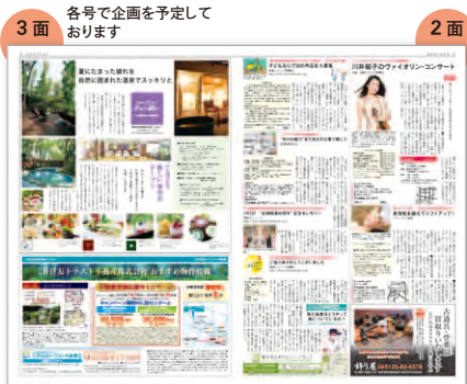
3面 各号で企画を予定しております