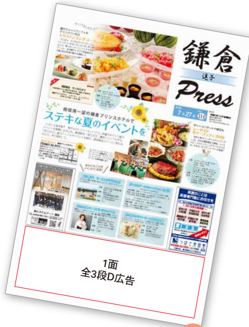
楽しい紙面をお届けします 1面