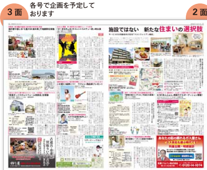
3面 各号で企画を予定しております