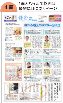
4面 1面とならんで終面は最初に目につくページ