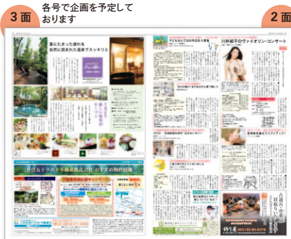
3面 各号で企画を予定しております