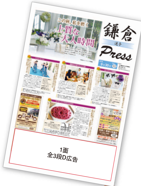
楽しい紙面をお届けします 1面