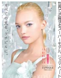
世界で活躍するスーパーモデルジェマ・ワード すべての光をツギヒルに。